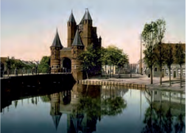
Haarlem, Amsterdamse Poort ca. 1900

hem over. Maar omdat het werk waarover dit boek gaat al gauw al hun aandacht opeist, en er in de crisistijd weinig schitterende economische vooruitzichten zijn, wijden zij zich geheel aan datgene, dat zij beiden als een opdracht ervaren.