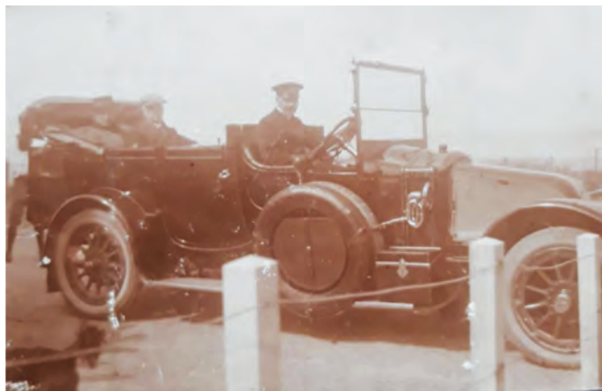
Penni met automobiel