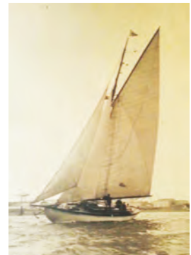
De García (1919)